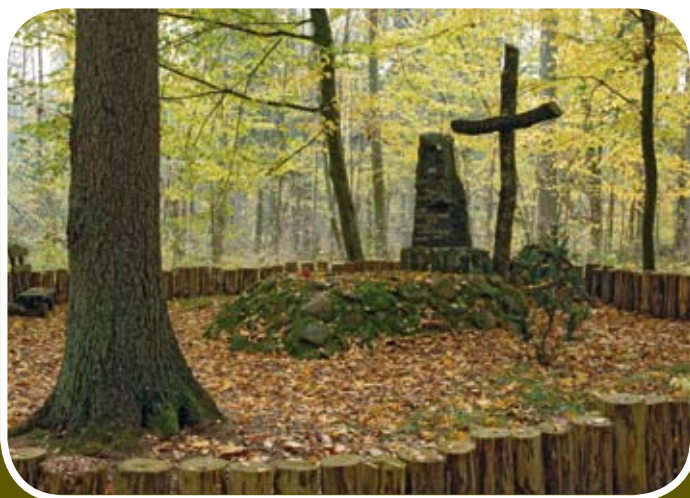
Pomnik upamiętniający bohaterkich Powstańców z lat 1863-64

proceedzi przez malownicze lasy rezerwatu przyrody „Kozi Rynek”. Rezerwat utworzono w roku 1959 na powierzchni ponad 145 ha. Obejmuje on fragment Puszczy Augustowskiej o cechach zbliżonych do lasu pierwotnego, z całą jego surowością i dzikością (fot. strona 1). Taką samą historyczną nazwę ma również uroczysko „Kozi Rynek”, które z uwagi na niedostępność i puszczański charakter było miejscem stacjonowania największego na Augustowszczyźnie oddziału powstańczego w latach 1863-64. Wydarzenia te upamiętnia pomnik. W czasach wojen uroczysko było też schronieniem żołnierzy i partyzantów, polem bitew, a także miejscem pochówku poległych. Ścieżka ma postać pętli, rozpoczynającej i kończącej się przy leśnym parkingu obok rezerwatu. Na trasie ścieżki znajdują się tablice informacyjne pozwalające na samodzielne zapoznanie się ze specyfiką prac leśnych. Grupy zorganizowane mogą poprosić w siedzibie Nadleśnictwa Augustów o przewodnika.