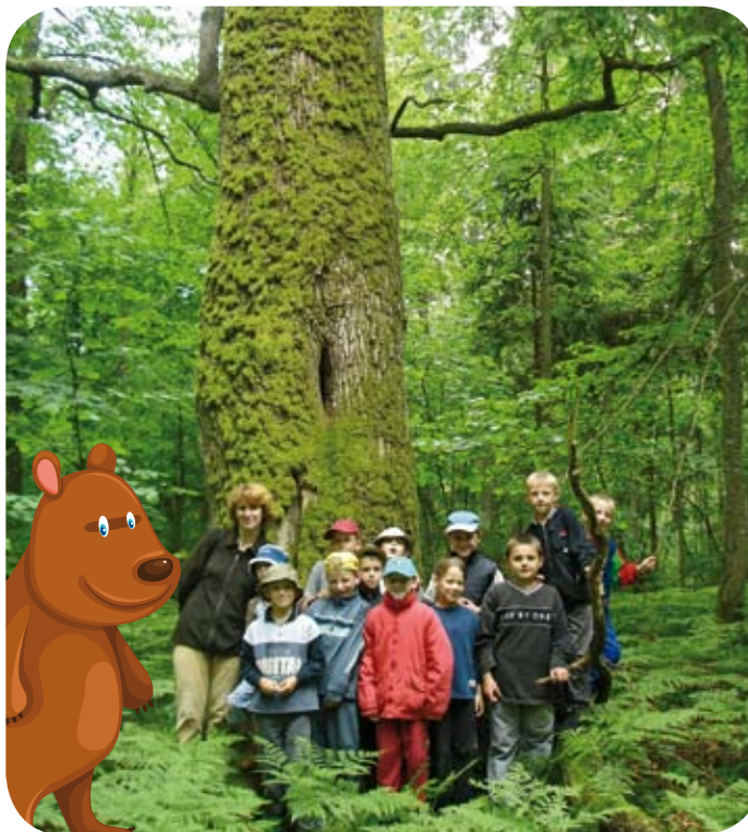
Wiekowy dąb jest ulubionym motywem pamiątkowych fotografii

UWAGA! Duże oddalenie od ludzkich siedzib, liczne wykroty, grząski grunt oraz niebezpieczne bagna stwarzają bardzo poważne zagrożenie dla zdrowia i życia!