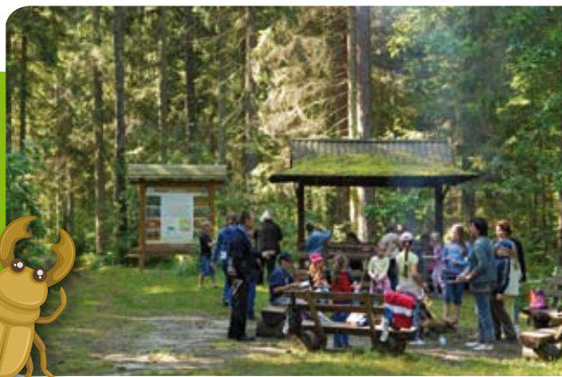
Przy wejściu na ścieżkę przygotowano zadaszanie i miejsce na ognisko

Tereny administrowane przez Nadleśnictwo Augustów obejmują obszary o wyjątkowych walorach przyrodniczych, kulturowych i krajobrazowych. Stanowią fragment jednego z największych kompleksów leśnych w Polsce – Puszczy Augustowskiej – będącej od wieków ostoją dzikiej przyrody. Najcenniejsze tereny objęte są ochroną rezerwatową. Zgodnie z postanowieniami Ustawy o lasach działania prowadzone w Nadleśnictwie Augustów są zgodne z ideą zrównoważonego wykorzystania wszystkich funkcji lasów, w tym również funkcji ekologicznej. Jednym z działań edukacyjnych jest wytyczanie ścieżek opisanych w serii broszur, których przykładem jest niniejsza.