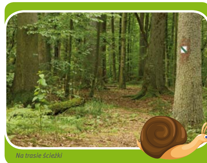
Na trasie ścieżki

Dojazd: na trasie Augustów-Lipsk, w lewo, zgodnie z oznakowaniem